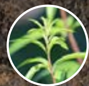
La hierba de limón