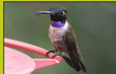
Colibrí barba negra