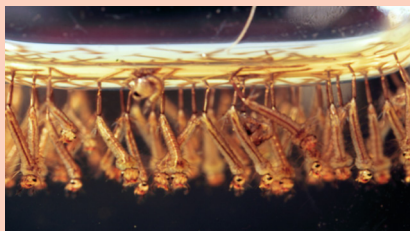
Larva de mosquito en etapa acuática

Los mosquitos son insectos voladores pequeños (aprox. 1/4 de pulgada) que tienen un papel importante en las redes alimentarias, pero pueden ser una molestia cuando hay muchos y, en el peor de los casos, propagar enfermedades como el virus del Nilo Occidental. Solo las hembras pican porque necesitan la proteína extra para producir huevos