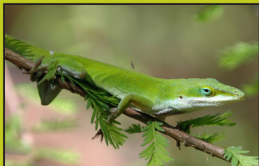
Anole verde: Wendy VanDyk Evans, Bugwood.org

Evite los exterminadores eléctricos, los aspersores de mosquitos y los atomizadores, pueden dañar o matar sin querer a los insectos que son beneficiosos y a otra vida silvestre. Los estudios demuestran que los exterminadores eléctricos no son efectivos contra los mosquitos.