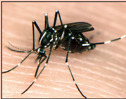
Mosquito tigre asiático adulto