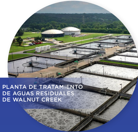
PLANTA DE TRATAMIENTO DE AGUAS RESIDUALES DE WALNUT CREEK