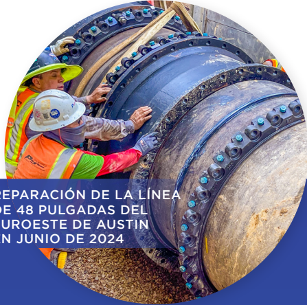
REPARACIÓN DE LA LÍNEA DE 48 PULGADAS DEL SUROESTE DE AUSTIN EN JUNIO DE 2024